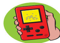
Hand Held Games PS/PS2 etc..